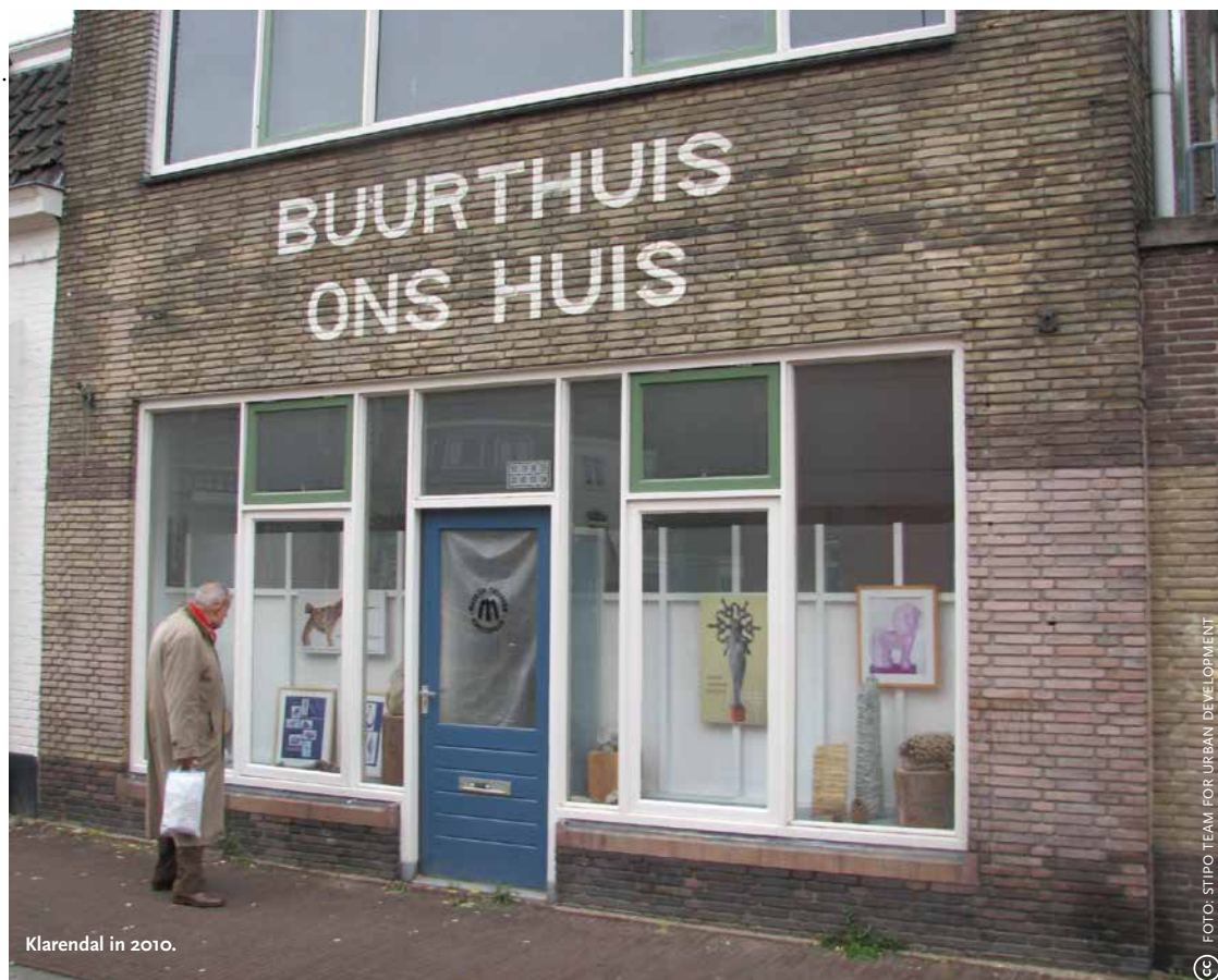
Klarendal in 2010.

Het Arnhemse Klarendal is veranderd van krachtwijk in een leefbare volkswijk met een Modekwartier. Vanuit de Radboud Universiteit hebben we deze veranderingen onderzocht. In Geografie rapporteren we de komende tijd over onze bevindingen, telkens vanuit een andere invalshoek.