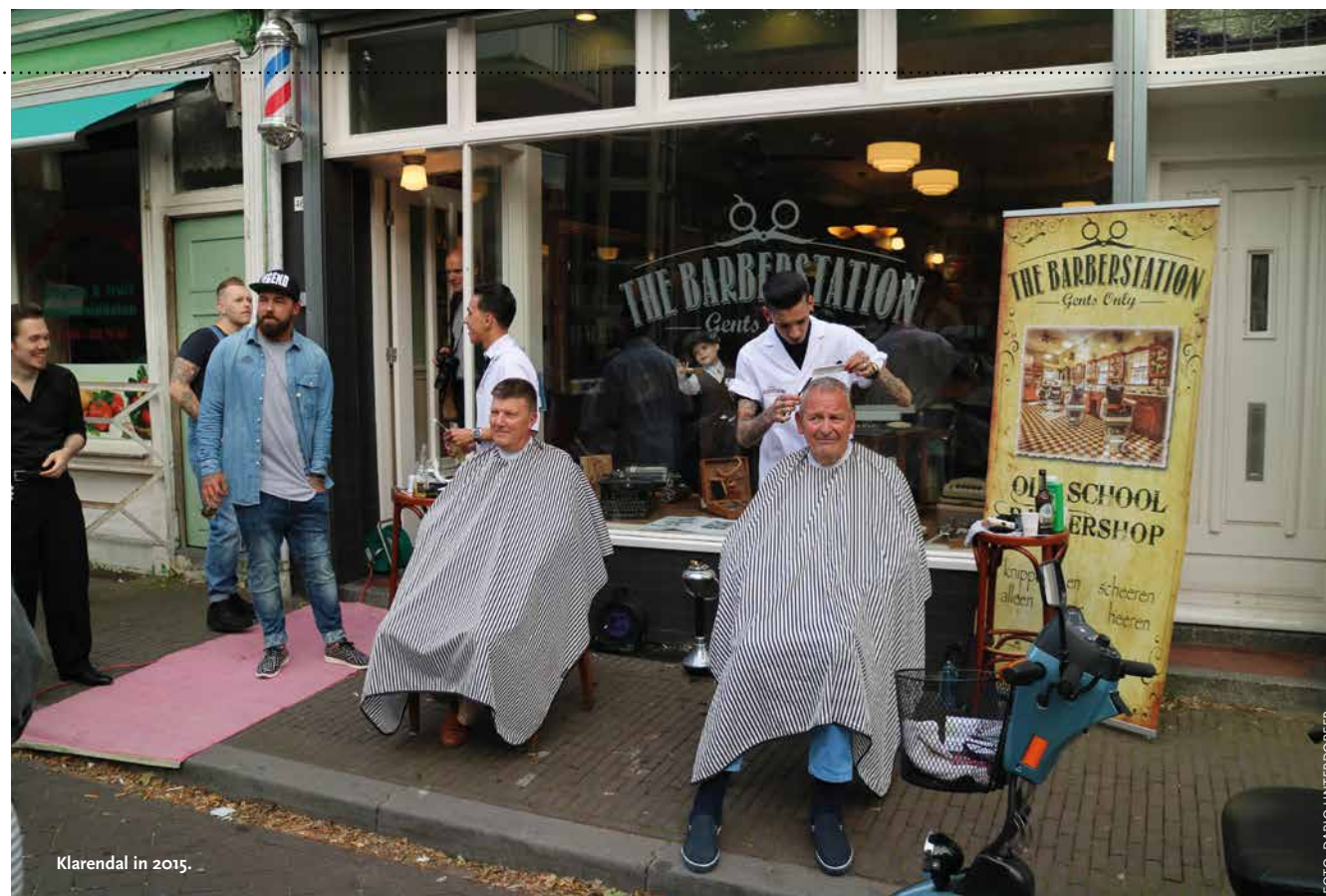
Klarendal in 2015.