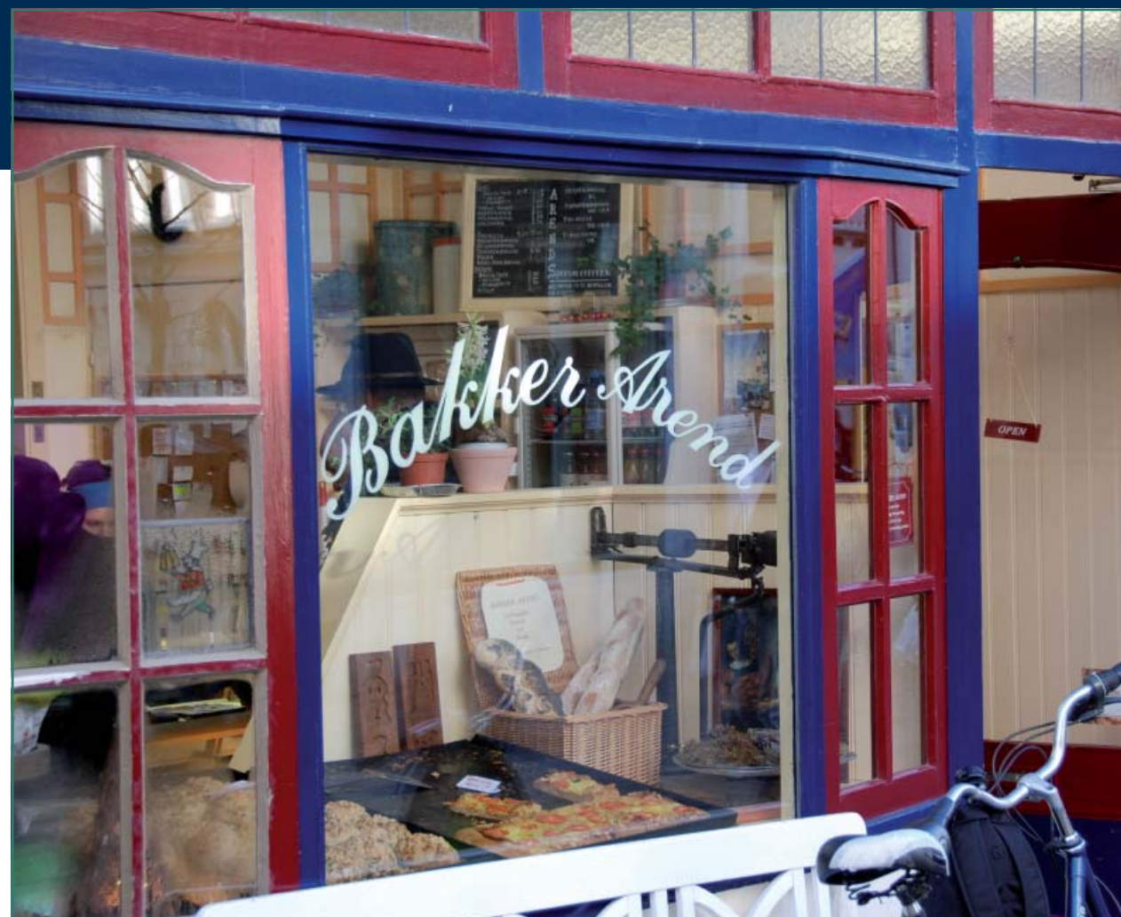
Figuur 3: 'De eigenaar van Bakker Arend vertelde me dat Arnhemmers speciaal voor hun mueslibollen naar Nijmegen komen. Een lokale zaak met een bovenlokale functie' (afkomstig uit de presentatie van Door Hendriksen).

steden op eigen wijze, markeert deze en richt deze op een bepaalde manier in. Standbeelden, posters, graffiti, verbodsborden, hekwerken, beplanting, voorzieningen, of juist het ontbreken daarvan, laten zien hoe mensen een bepaalde ruimte betekenis geven. Het zijn niet alleen materiële zaken die de identiteit van een plaats bepalen. Ook de aanwezigheid (of afwezigheid) en het gedrag van mensen op die plaatsen dragen bij aan de identiteit. Door hun activiteiten, wijze van kleden, manier van voortbewegen en inkopen geven ze die plek een bepaalde sfeer en uitstraling die vaak weer afwijkt van andere plaatsen (figuur 1).